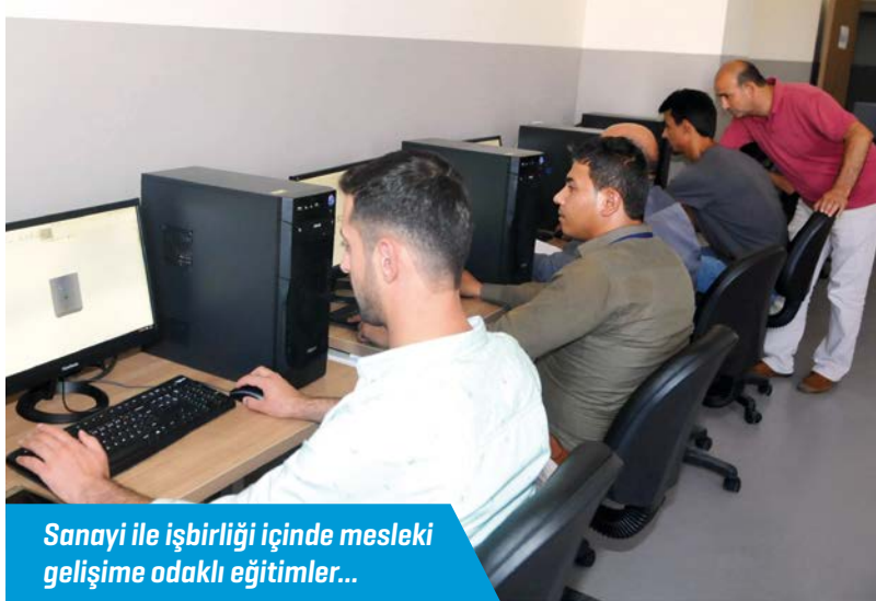
Sanayi ile işbirliği içinde mesleki gelişime odaklı eğitimler...